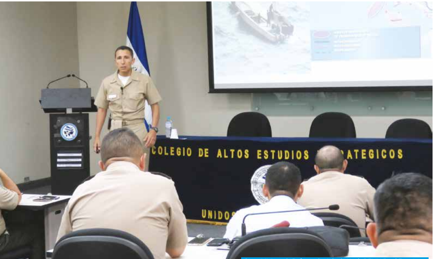
Señor Ministro de Defensa, Capitán de Navío DEMN René Francis Merino Monroy, imparte conferencia en el CAEE.

misión integrada por señores oficiales superiores, para desarrollar el Reglamento del "Sistema Educativo de la Fuerza Armada". El 15 de julio de 1992, la comisión referida remitió el Reglamento, el cual en el folio nueve menciona el "Nivel de Estudios Estratégicos", que estará integrado por militares con grado de Teniente Coronel y Coronel, así como civiles miembros de la Administración Pública designados por el Presidente de la República y que tendrá por objetivo conocer las responsabilidades de todos los sectores nacionales en el sostenimiento y existencia del Estado y la capacitación en materias relativas a la Seguridad Nacional y Desarrollo (Lopez Fuentes, 2018).