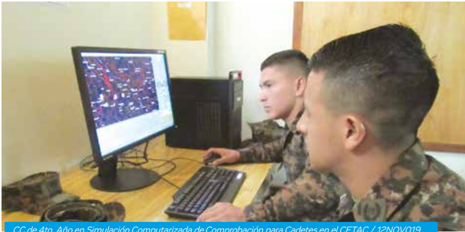
CC de 4to. Año en Simulación Computarizada de Comprobación para Cadetes en el CETAC / 12NOV019