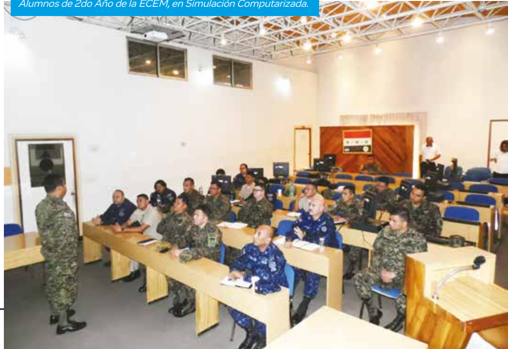
Alumnos de 2do Año de la ECEM, en Simulación Computarizada.