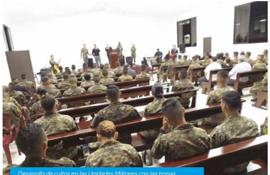
Desarrollo de cultos en las Unidades Militares con las tropas.

A través de la mencionada escuela y en coordinación con el Instituto Bíblico y la Universidad Cristiana Sion de los Estados Unidos de América, se ha desarrollado a partir de noviembre de 2018 hasta noviembre de 2019, un curso de formación teológica durante 12 módulos. Este curso se estableció