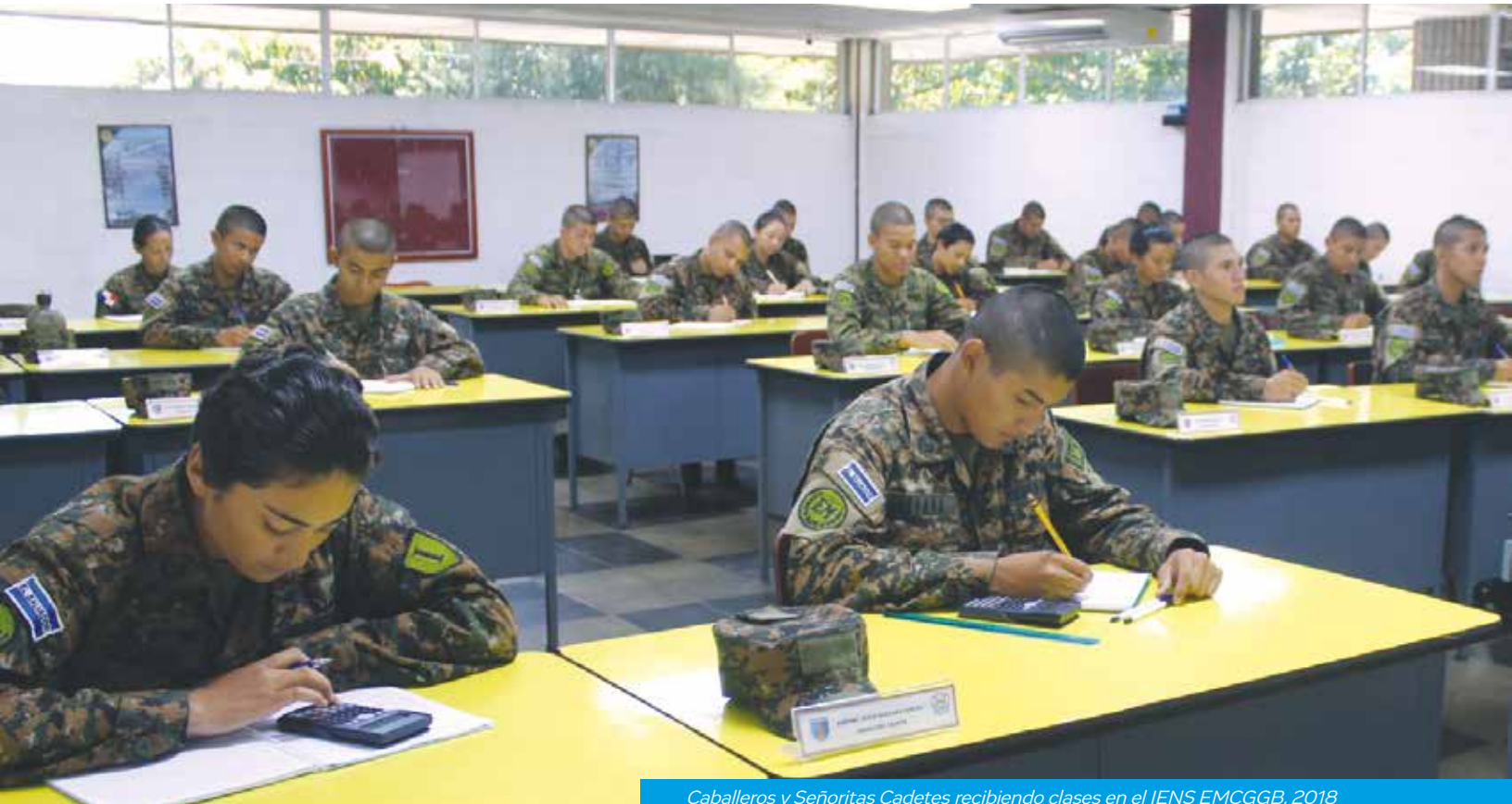
Caballeros y Señoritas Cadetes recibiendo clases en el IENS EMCGBB, 2018