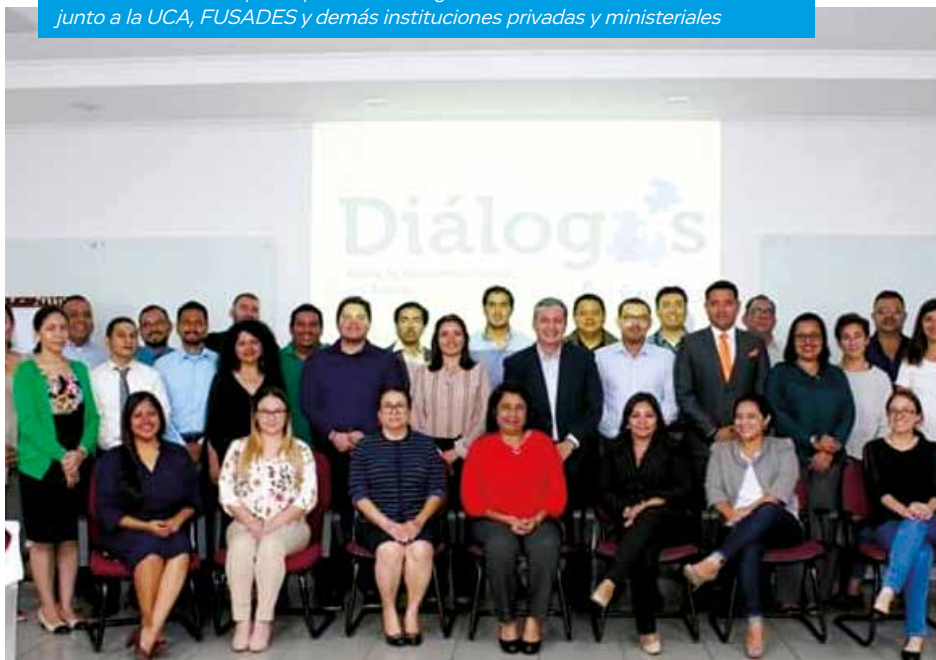
24SEP019 El CAEE participó en los diálogos sobre Descentralización del Estado junto a la UCA, FUSADES y demás instituciones privadas y ministeriales

A nivel bilateral con colegios homólogos, el CAEE participa de manera permanente en las actividades académicas, investigación y de proyección social que desarrollan, esto permite que el CAEE mantenga convenios de cooperación con el Centro Superior de Estudios de la Defensa Nacional de España CESEDEN (2014); Escuela Superior de Guerra de Colombia ESDEGUE