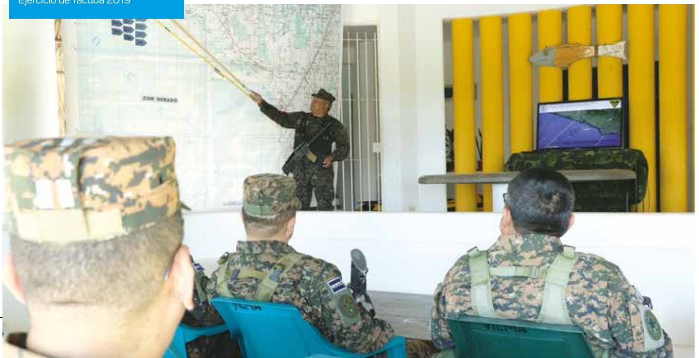
Ejercicio de Tacuba 2019

Es de esta manera que se pueden considerar como ejercicios militares sin tropas los siguientes: ejercicio sobre la carta topográfica, ejercicio aplicado sobre croquis, ejercicio en cajón de arena o maqueta, simulaciones computarizadas, juegos de guerra y excursiones tácticas; los cuales se definirán a continuación para un mejor entendimiento de sus generalidades y propósitos.