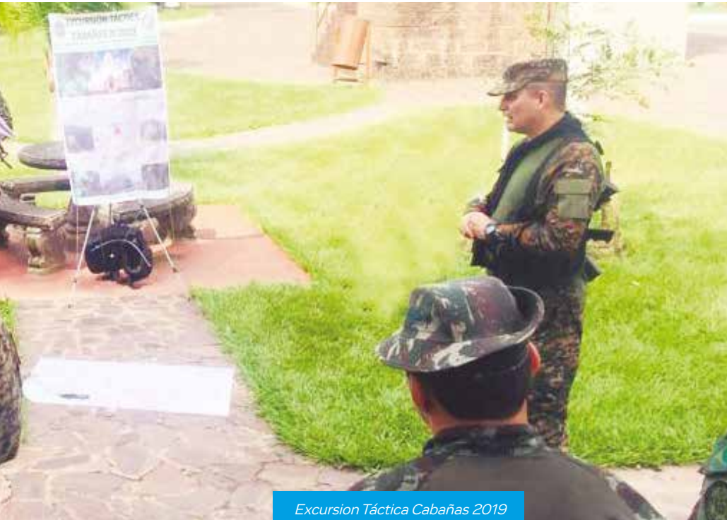
Excursión Táctica Cabañas 2019