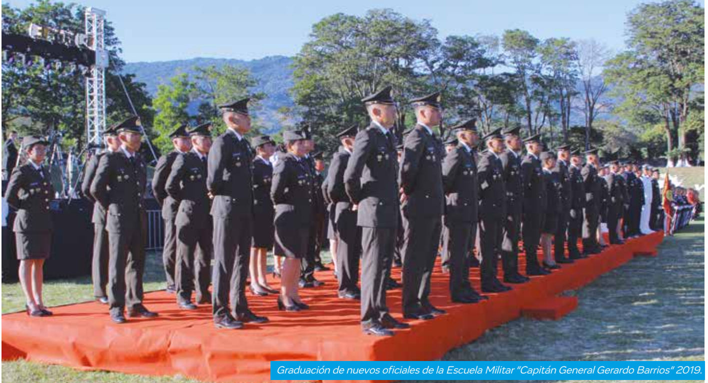
Graduación de nuevos oficiales de la Escuela Militar "Capitán General Gerardo Barrios" 2019.

Se busca que el cadete adquiera las competencias profesionales vinculadas con la investigación científica, socio-humanísticas, desempeño táctico terrestre y conocimiento pertinente de la toma de decisiones.