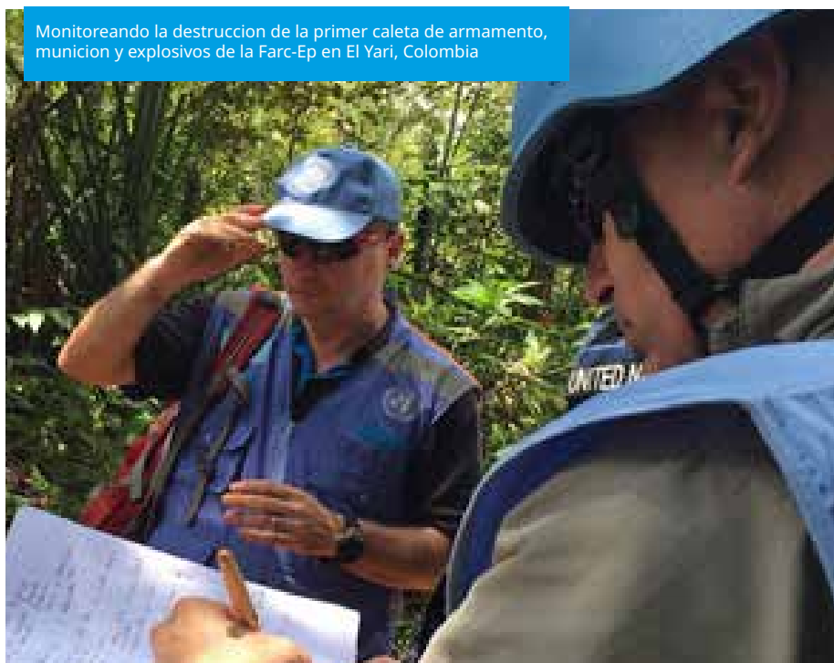
Monitoreando la destrucción de la primer caleta de armamento, munición y explosivos de la Farc-Ep en El Yari, Colombia

Las FARC – EP fueron conducidas al principio de manera coordinada y descentralizada desde las regiones donde se encontraban situadas como fuerzas guerrilleras, para luego, en forma progresiva y en función de la logística disponible, trasladarlas a las sedes locales temporales y, por último, a las sedes locales definitivas.