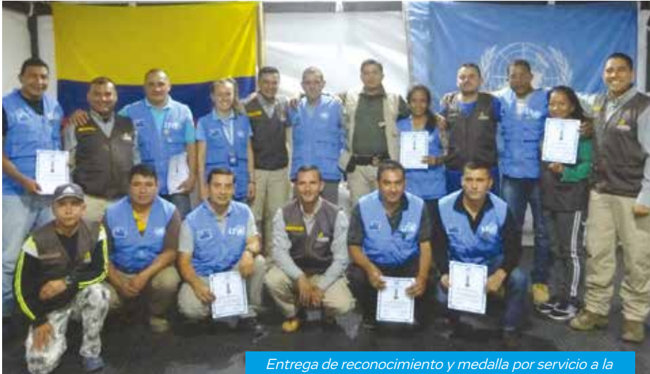
Entrega de reconocimiento y medalla por servicio a la Misión del Proceso de Paz de Colombia

niciones puntuales de los más variados grupos y organizaciones sociales, sectores de opinión, movimientos y partidos políticos, se introdujeron numerosos e importantes cambios y modificaciones sustanciales a los primeros textos, hasta convertir el acuerdo de paz anterior en un nuevo Acuerdo Final para la Terminación del Conflicto y la Construcción de una Paz Estable y Duradera, el 24 de noviembre de 2016;