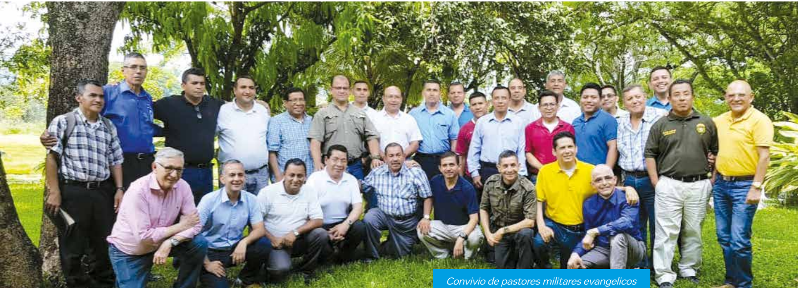
Convivio de pastores militares evangélicos